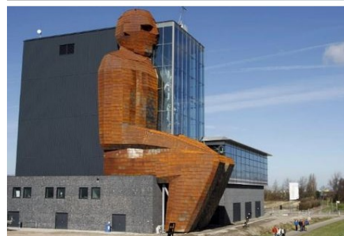
Corpus - Archief foto Gepubliceerd 22 maart 2013 23:55 | Laatste update 22 maart 2013 23:55